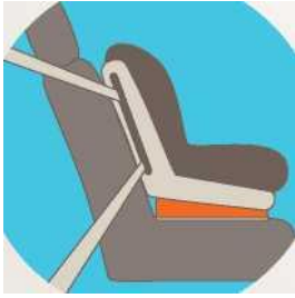
Лицом по ходу движения