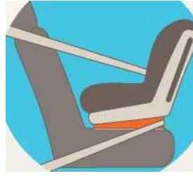
Лицом против движения